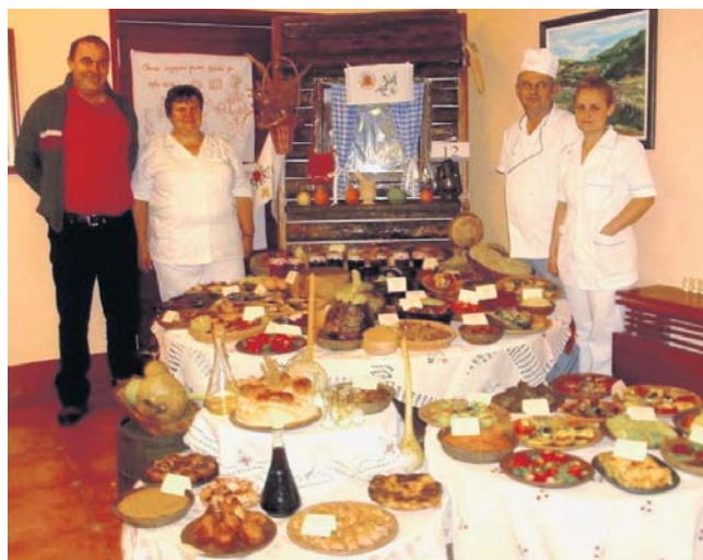
Најбоља екипа Војне установе „Тара“