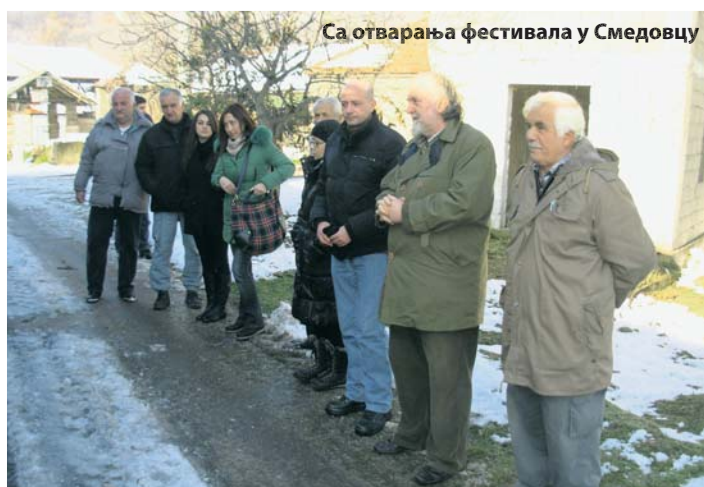
Са отварања фестивала у Смедовцу