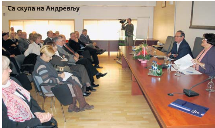
Са скупа на Андrevљу