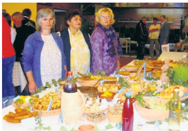
Удружење жена „Злакуса“

Хотел „Језеро“ у Перућцу и „ЕПС-турс“ 30. новембра били су домаћини туристичко-гастрономске манифестације „Сто посне хране“ која је окупила 15 екипа из Србије, Црне Горе и Македоније. Стручни жири имао је тежак задатак да од неколико стотина припремљених посних јела и специјалитета издвоји најбоља и најкуснија. Јер, међу укусним ђаконијама нашле су се разне врсте рибе, славске погаче, пасуљ пребранац, пите