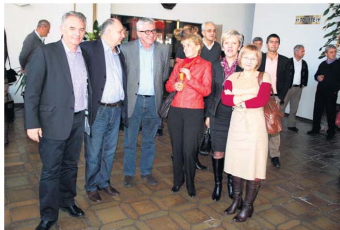
Пословни пријатељи из Фонда ПИО

них пацијената остварило 16.000 болничких дана. Ове године је превентивни опоравак користило и 166 радника и 770 пензионера које је о свом трошку на рехабилитацију упутио Републички фонд ПИО. Пансионско-хотелске услуге користило је око 1.000 го-