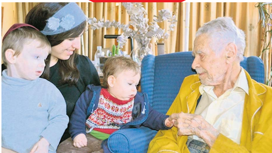
Без сопственог потомства: са родбином на 108. рођендан

Доскорашњи најстарији мушкарац на планети век провео у изучавању паранормалних појава и необјашњивих феномена, а управо један такав био је и сам његов живот