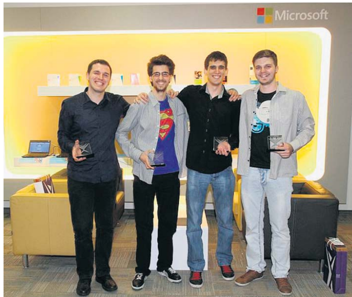
Чланови тима који се пласирао у светско финале Imagine Cup-а

Идеја за „Sonochrome“ потекла је из говора „Слушам боје“ Нила Харбисона на ТЕД глобал