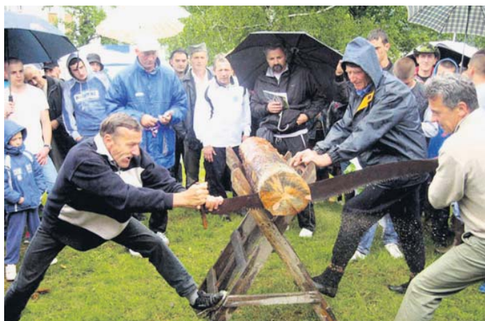
Ручно стругање балвана

шебоја: „вуча на влаци” коњском и воловском запрегом, бацање камена с рамена, скокови удаљ и увис, пузање уз бандеру, надвлачење конопцем, превлачење кличка, ручно стругање балвана