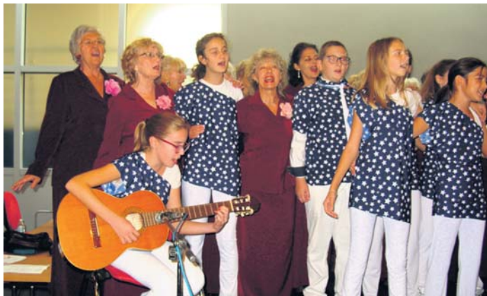
Смотру заједнички отворили дечији хор и пензионерски хор „Исидор Бајић” из Новог Сада