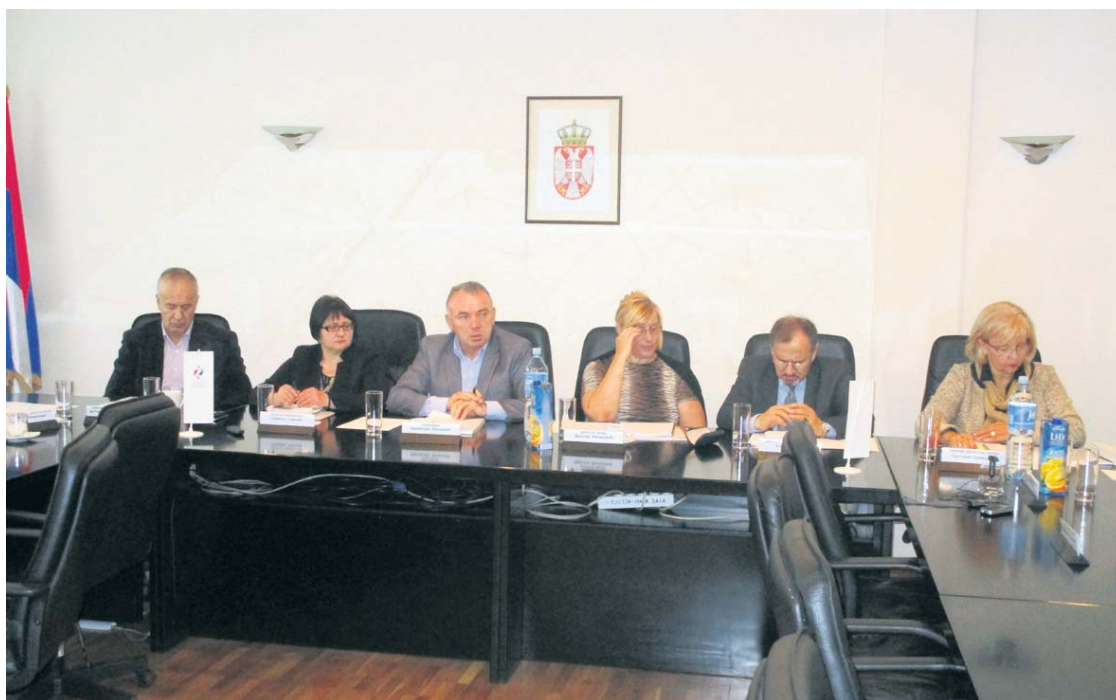
Управни одбор разматрао Информацију о финансијском пословању

Учешће трансфера из буџета Републике Србије у укупним примањима и приходима Фонда је 37,81 проценат, што представља смањење у односу на претходну годину када је износило 45,84 одсто