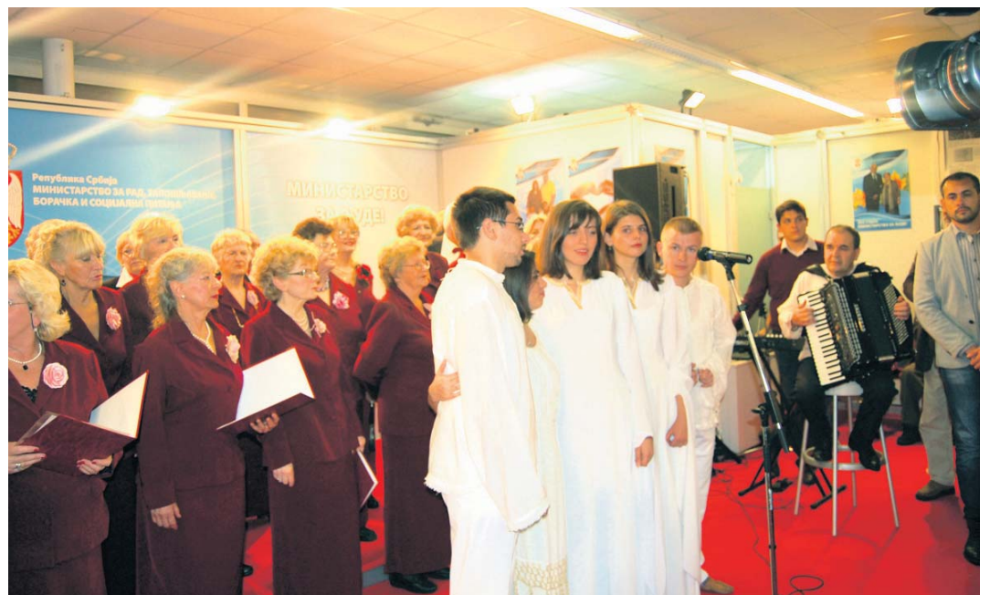
На отварању штанда Министарства

– Код запослених у субјектима приватизације и предузећима за професионалну рехабилитацију и запошљавање особа са инвалидитетом, повезивање стажа односи се само на оне запослене који су испунили услов за пензију и поднели захтев за пензионисање у овој години или раније, а то право нису могли да остваре јер им нису уплаћивани доприноси. Такође, стаж могу да повежу запослени који су сами себи уплатили доприносе уместо својих послодаваца, и они по закључку владе имају право на повезивање стажа. Они ће након реализа-