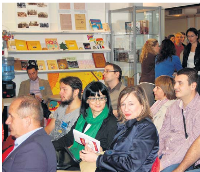
Трибине увек биле посећене