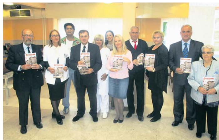
Представљен билтен „Дружбеник“

Након доделе награда, програм су наставили чланови плесне школе Стари град 50+, као и ве-