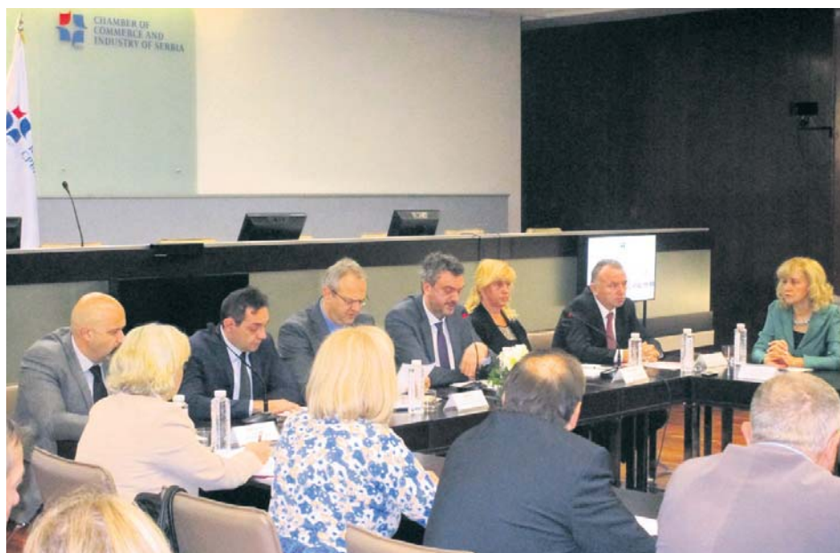
Са скупа у Привредној комори Србије

– Активна сарадња Привредне коморе Србије и Фонда ПИО, коју ћемо и дефинисати будућим меморандумом, апсолутно ће утицати на ефикасније утврђивање података о стажу осигурања, података о зарадама и уплаћеним доприносима – навела је директорка Фонда.