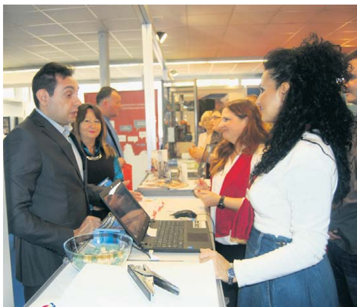
На пулту Фонда ПИО