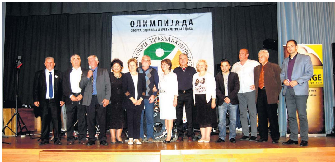
Организациони одбор Олимпијаде

На досадашњих осам успешних надметања учествовало је близу 6.000 људи трећег доба, који су освајали медаље, стизали први или последњи држећи се олимпијског начела „важно је учествовати“