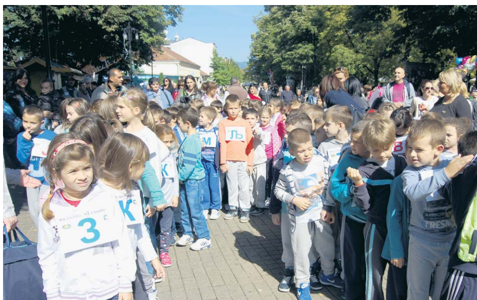
Трка „На слово на слово“