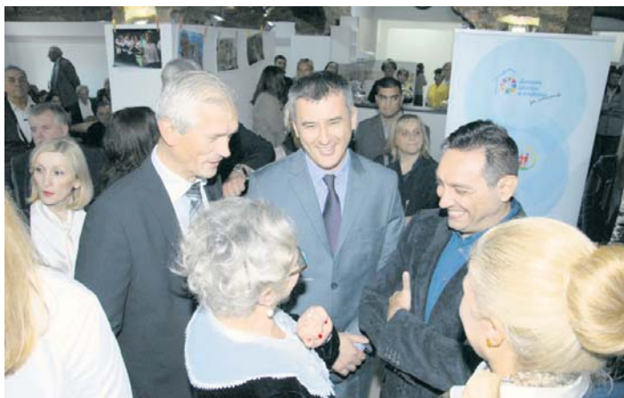
Вулин: поштовање за претходне генерације