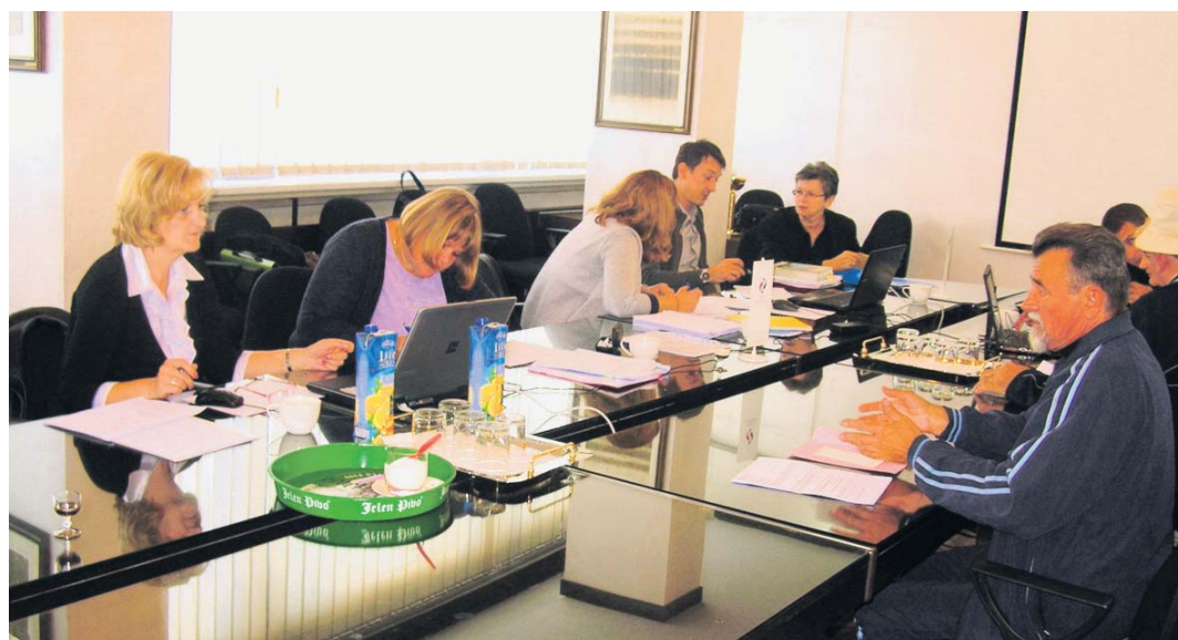
Правни савет и тражене информације на лицу места