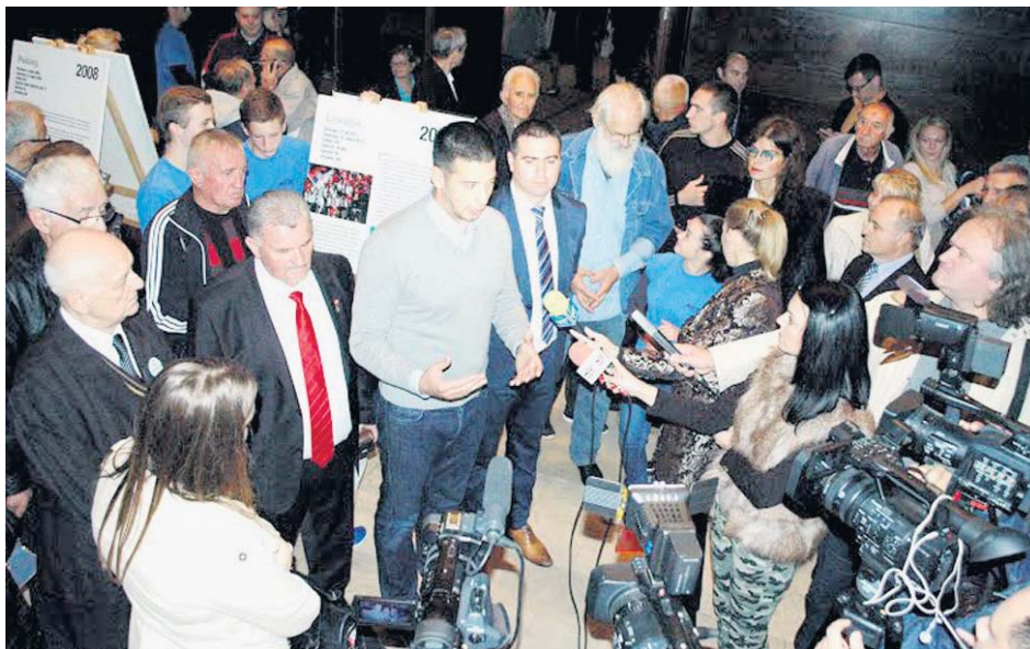
Министар Удовичић на отварању