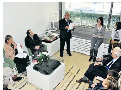
Проглашење победника конкурса „Тајна лепе старости“

На свечаности поводом обележавања Међународног дана старијих, ауторима најбољих радова пристиглих на конкурс ГО Звездара „Тајна лепе старости“ додељене су пригодне награде. Овом свечаношћу завршена је манифестација „Дани сениора на Звездари“, пета по реду, коју је, под слога-