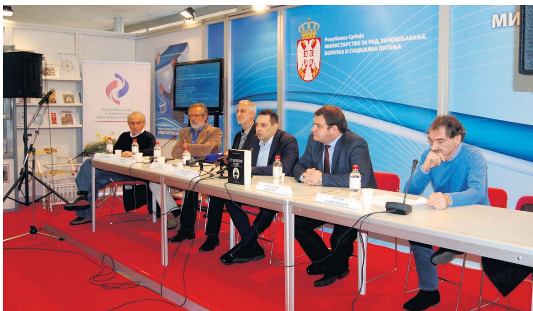
Министар Вулин на једној од трибина

– Битно је само да се у том поступку усаглашавања утврди који су то сви запослени на које се односи мера повезивања стажа. Проблем представља то што неки послодавци немају баш сасвим ажурну евиденцију о свим запосленима који су раније отишли да би их ставили на спискове, па би било добро да се ти запослени сами јаве фирмама, поднесу захтев и траже од послодавца да их ставе на списак да уђу у поступак пове-