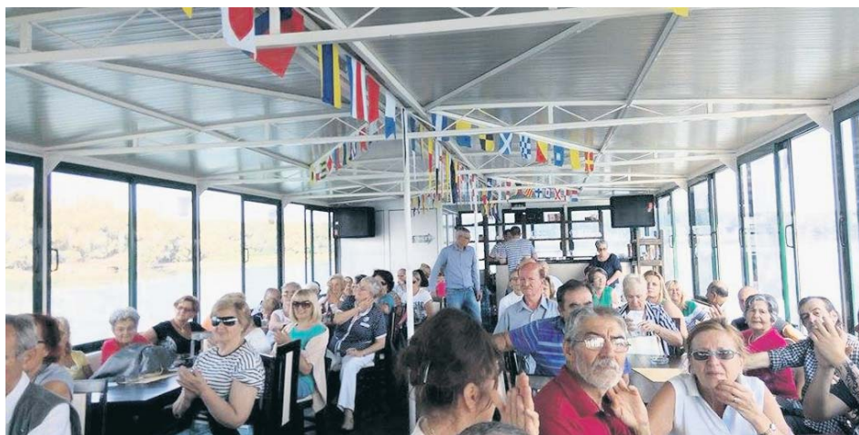
Пловидба рекама Београда уз позоришне представе

не су позоришне представе у извођењу драмских група геронтолошких клубова из Зрењанина, Лазаревца, Културног центра „Чукарица“ и драмске трупе „Пита луда куда“ београдских клубова за старије. Представе је, уз пловидбу рекама Београда, организовала Радна јединица „Дневни центри