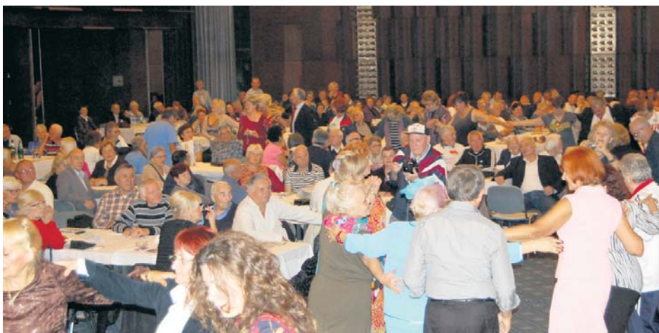
Весело сваке вечери

Према оценама учесника, новина на Олимпијади, занимљива трка ђака првака ОШ „Попински борци“ – „На слово, на слово...“ у којој је 30 девојчица и 30 дечака трчало на стази дуге 30 метара носећи ћирилична слова наше азбуке, требало би да постане традиционална. Уз аплаузе скоро свих учесника Олимпијаде, који су испунили бањску променаду, победила су слова М (код девојчица) и О (код дечака). Победницима су додељене златне медаље и