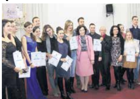
Победници из свих категорија

Као и претходних осамнаест година током дводневног такмичења орила се песма у изузетно акустичној свечаној сали ОШ „Душан Јерковић”. Учесници су били подељени у више категорија, с тим што су посебно оцењивани девојке и младићи.