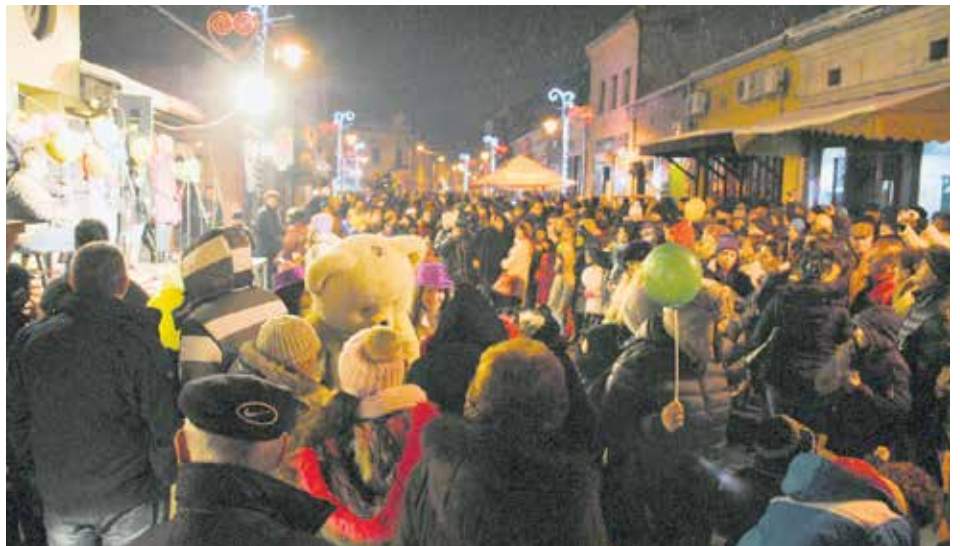
Јануарском саборовању радују се све генерације Крајинаца

У духу времена када су у Кнез Михаиловој отворене прве занатске и трговинске радње, а Неготинци се дружили, певали и беседили о свом граду и крајинским великанима, „Весела чаршија” је окупила бројне посетиоце и учеснике. Ово својеврсно саборовање промовише најбоље што Неготин има: грађански дух мале вароши, добро вино, широко срце и гостопримство, и као такво представља једну од најлепших зимских манифестација.