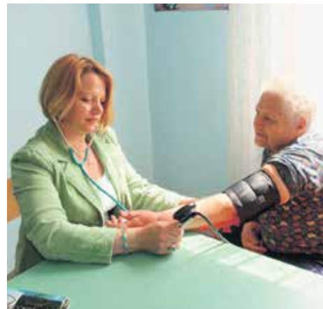
Докторка у кућној посети