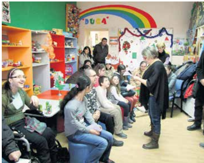
И чланови Удружења „Дуга“ добили новчану помоћ

Једнократну новчану помоћ од по пет хиљада динара добило је и 70 породица корисника туђе помоћи и неге са евиденције Центра за социјални рад, а међу њима и 19 чланова Удружења за помоћ особама са инвалидитетом „Дуга“.