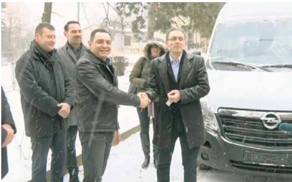
Министар Вулин у Нишу

– Ово је шесто возило које је у град стигло посредством Министарства. Ниш је град од огромне важности за Србију не само због своје величине већ и због људи који у њему живе. Мигрантску кризу није иза-