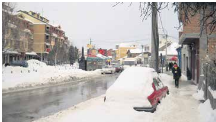
Лесковац ове зиме

Ванредно стање због временских неприлика проглашено је у општини Медвеђа, чији Центар за социјални рад, као и Општински штаб за ванредне неприлике дежурају целодневно. У оближњем Вучју снег је притиснуо засеок планине Кукавице. Осмог дана од почетка нове године овде је измерено у просеку 97 центиметара снежног покривача, а истог дана на