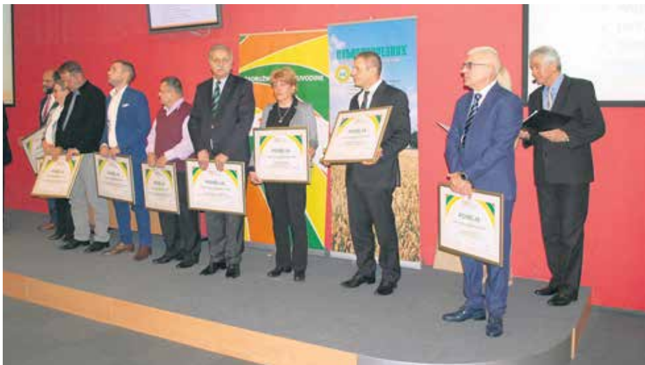
Добитници повеље Задружног савеза Војводине

– У Војводини је данас активно 400 задруга са 100.000 чланова, у просеку једна по насељеном месту. Настављају традицију и боре се за своје место на тржишту. Постоји још доста неискоришћених капацитета за задружно организовање јер је задругарство и садашњост а сигурно и будућност. Задруга је добровољно отворено, самостално друштво којим управљају њени чланови, а својим радом и коришћењем њених услуга на темељу заједништва и узајамне помоћи остварују своје појединачне и заједничке интересе и остварују циљеве због којих је задруга основана – навео је Јованов у обраћању присутнима.