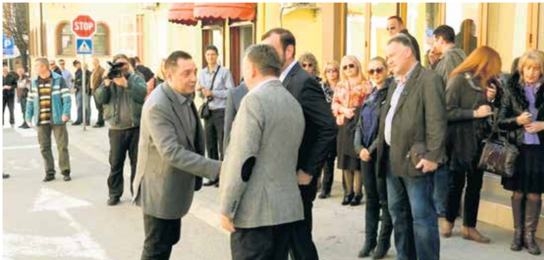
Министар Александар Вулин у Рашки

Министар је том приликом навео да министарство на чијем је челу постоји да би било на располагању људима и што ближе корисницима. Политика министарства које води је та да све услуге буду приближене корисницима и да свако право