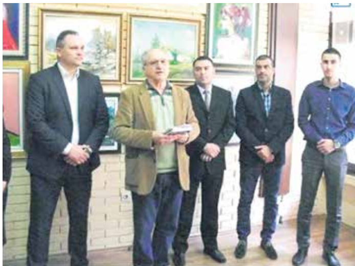
Са отварања клуба Селенча