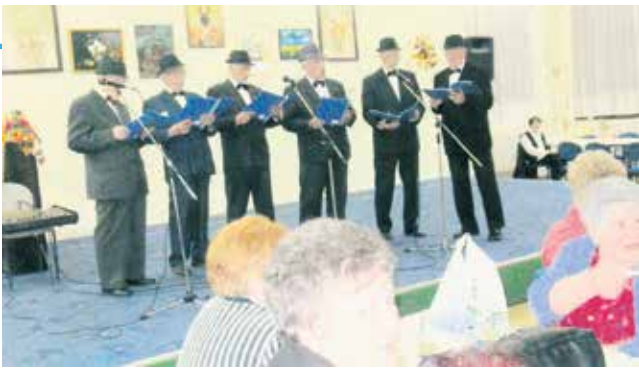
Певај мушки, на Дан жена