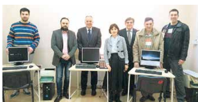
Дародавци са представницима школе

ПКВ ће успоставити континуирану сарадњу са ШОСО „Милан Петровић“, да би помогла ученицима школе да се, након завршеног средњег образовања, лакше укључе у рад привредних субјеката на територији Војводине.