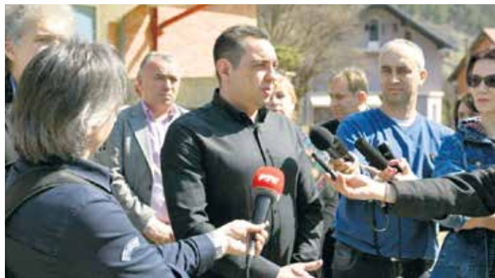
Обраћање новинарима у Босилеграду

које грађани имају мора бити задовољено, без трошкова или са минимумом трошкова и без губитка времена, у складу са њиховим здравственим могућностима.