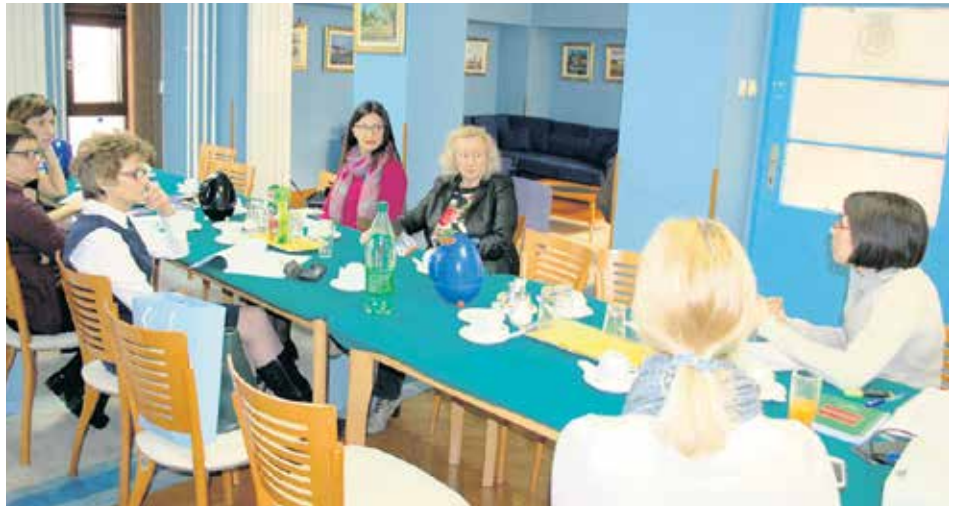
Са стручног скупа у Покрајинској влади

Гошћама из Крагујевца представљене су активности Секретаријата које су усмерене ка запошљавању жена са искуством насиља у породици на територији АПВ, као и резултати и ефекти мера које се реализују у оквиру покрајинског Програма за заштиту жена од насиља у породици. Програм представља меру субвенционисаног запошљавања и интервентни програм за жене са искуством насиља које су најмање конкурентне на тржишту рада и којима је најтеже да остваре економску независност. У оквиру ове мере средства се одобравају