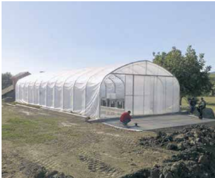
Стигла опрема за повртарску производњу

– Жене су добиле комплет пластенике, шипке, најлон, мрежице и овог пролећа моћи ће да крену са сопственом производњом. У разговору са нама оне су