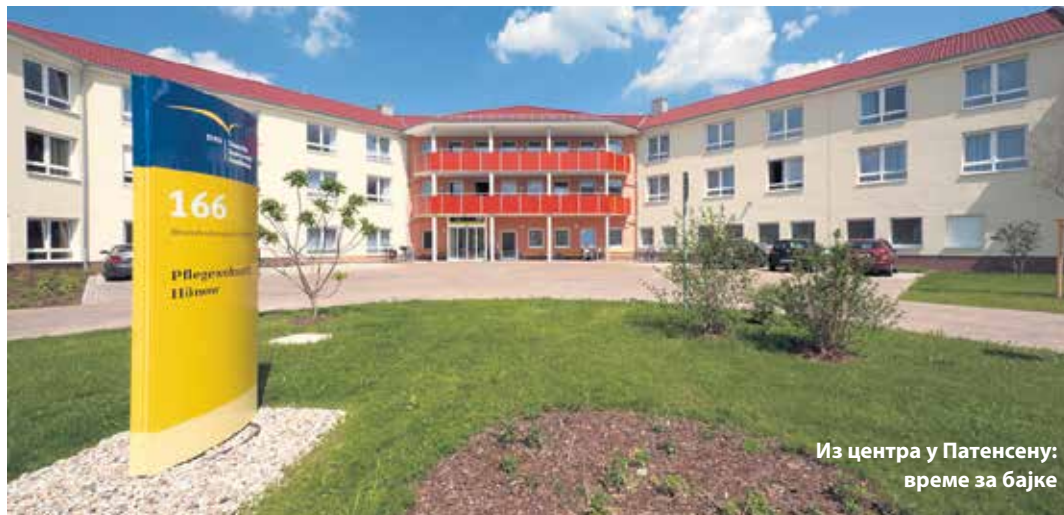
Из центра у Патенсену: време за бајке

Новинар британског „Гардијана“ који је посетио центар у