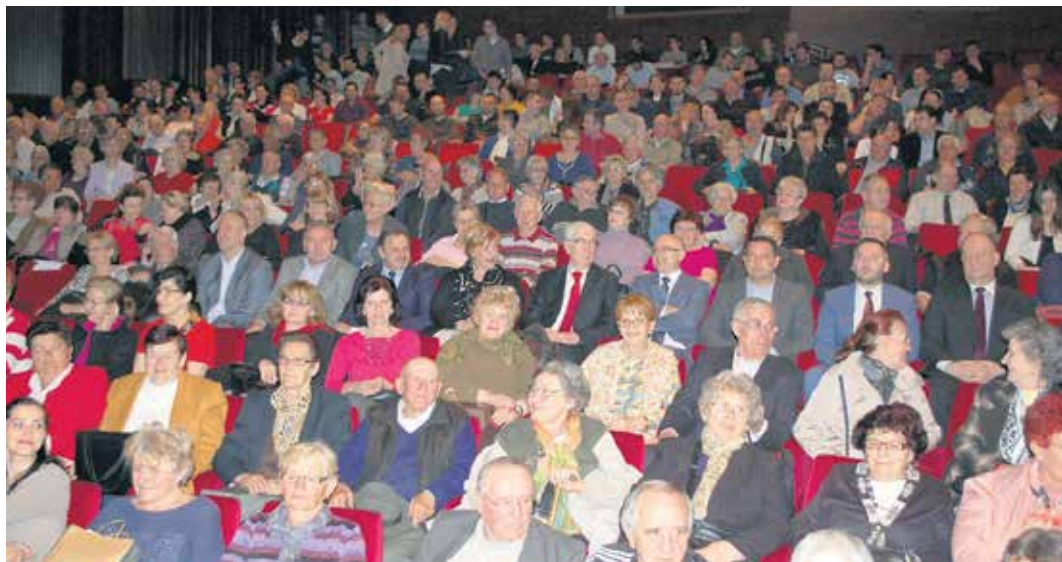
Министар Вулин и челни људи Фонда ПИО са пензионерима

– Укупно 1.728.000 пензионера у Србији не представљају терет већ су то људи који су створили нашу земљу и можемо само да им будемо захвални на томе. Ове године је за друштвени стандард пензионера Фонд ПИО издвојио око 394 милиона динара, па ће у бање отићи 12.500 пензионера, што је за 1.500 људи трећег доба више него прошле године. Очеку-