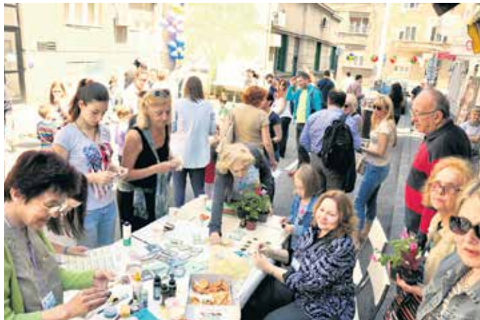
Дан комшија на Звездари

Целе године се одржавају омиљене радионице. Једна од њих носи назив „Урбани баштовани” где грађани могу да добију инструкције и информације о свему што их занима у вези са развијањем вештине гајења биљака. У „Кући лепоте за сениоре” обезбеђене су бесплатне занатске услуге фризера, педикера и маникира за најстарије, а у „Галерији на точковима” – изложба радова сени-