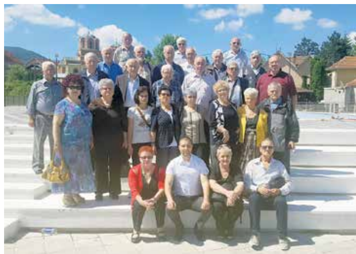
Пензионери на базену у Сврљигу