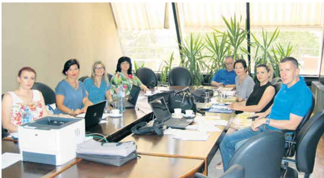
Македонски и српски тим саветодаваца у Београду

– Странке су деловале апсолутно задовољно и добиле су одговоре на сва досад нерешена питања. Упућени су на који начин, уколико је потребно, да поднесу неки нови захтев. Објашњено је све што им је било нејасно и недоумице које су им правиле проблем. Најчешћи проблеми тицали су се потврде стажа у Македонији и исплате