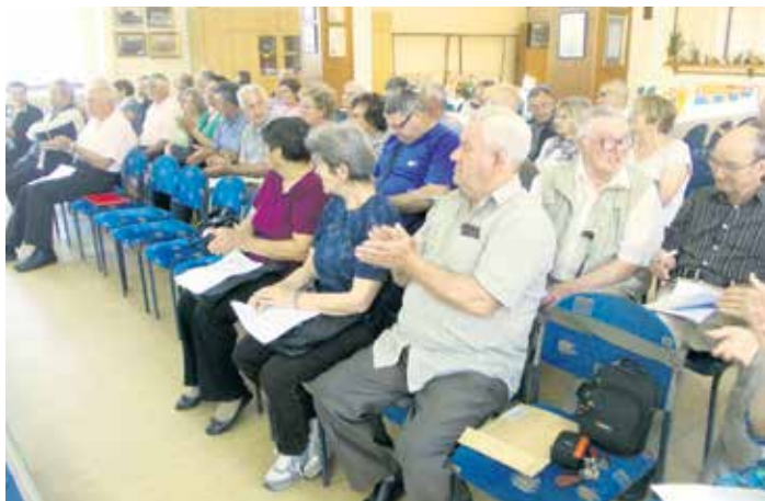
Са Скупштине пензионера Кикинде

Сличне просторије за свакодневно дружење постоје и у Башаиду, Мокрину у Банатском Великом Селу, за разлику од осталих села где функционишу основне организације пензи-