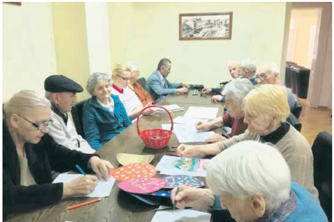
Креативна радионица у дневном боравку „Наше треће доба”

– „Наше треће доба” је први приватни дневни боравак за старије особе у Београду. Намењен је покретним и полупокретним особама које због година имају промене у психо-физичком стању (сенилна деменција, почетна фаза Алцхајмерове болести, мождани удар), због чега нису у стању да брину сами о себи већ им је потребна помоћ другог лица. Наш тим је састављен од стручног особља: социјални радник, медицинске сестре и неговатељице, радни терапеут и физиотерапеут који на одговарајући начин током