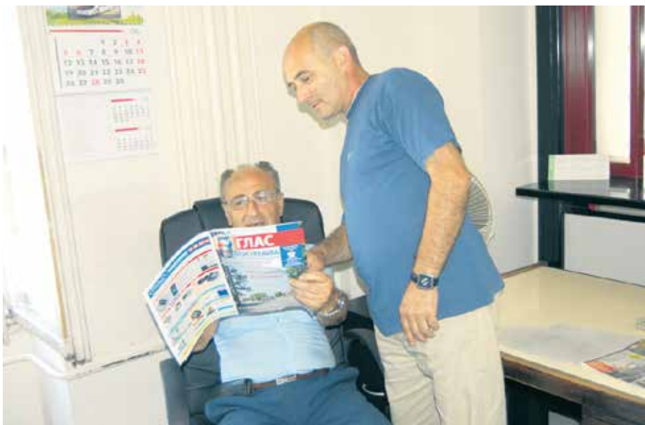
Прави пут до тачне информације

Све ове године били смо један од значајних канала комуникације са осигураницима и пензионерима, трудећи се да увек будемо информативни и актуелни, неуморно пратећи и бележећи све измене у систему пензијског и