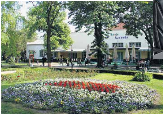
Бања Русанда, Меленци

У складу са жељама корисника пензије, расположивим капацитетима рехабилитационих центара и формираним ранглистама у складу са критеријумима,