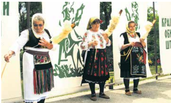
Златне руке сеоских домаћица – такмичење у брзом упредању вуне