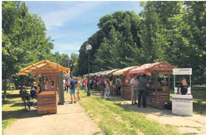
Штандови у Карађорђевој парку

– Овај сајам је настао из идеје да се оснажи женско предузетништво, презадовољне смо одзивом с обзиром на то да је први.