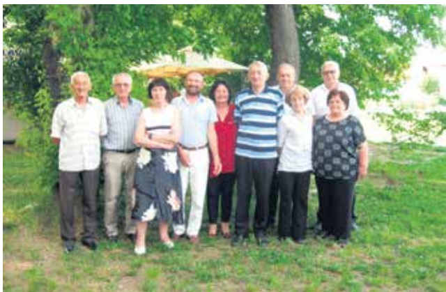
ПЕТРОВАЦ НА МЛАВИ