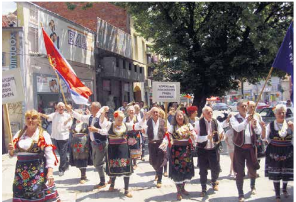
Лесковачки пензионери, домаћини фестивала

Више од два сата трајало је извођење традиционалних игара, а највеселији су били гости из Кавадараца. Ипак, на овом фестивалу сви су били победници, и сви они су добили захвалнице и посебна признања за досадашњу сарадњу. Посебан „жири“