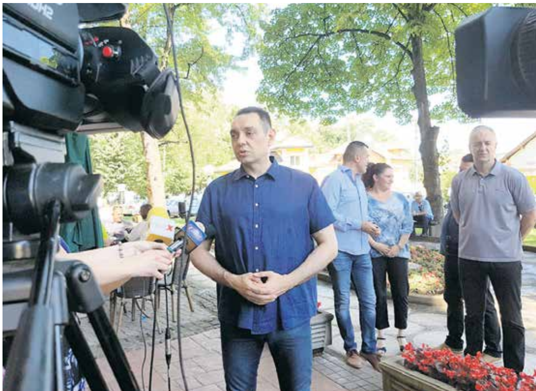
Министар Вулин нагласио значај бриге о пензионерском стандарду

– Када добро радите, када имате више запослених, када се боље наплаћују доприноси, можете да водите рачуна и о пензионерском стандарду. Политика Владе Александра Вучића је била, и свака следећа влада на коју пресудно буде утицао Александар Вучић, наставиће са таквом политиком, да све што зарадимо најпре поделимо са онима који су најзаслужнији, да они који су најсиромашнији прво осете зашто је добро што смо умирили државу, зашто је добро што смо обезбедили фискалну консолидацију. И зато данас, захваљујући већим уплатама, захваљујући већој количини новца у ПИО фонду, можемо да кажемо да смо 12.500 пензионера послали у бање, што је за више од хиљаду више него прошле године. Очекујемо да ћемо са овим трендом наставити и идуће године и да ће још више пензионера идуће године моћи на овај начин да оде у бању. Захваљујући већим доприносима, захваљујући већој количини новца, захваљујући томе што нисмо повукли 11,5