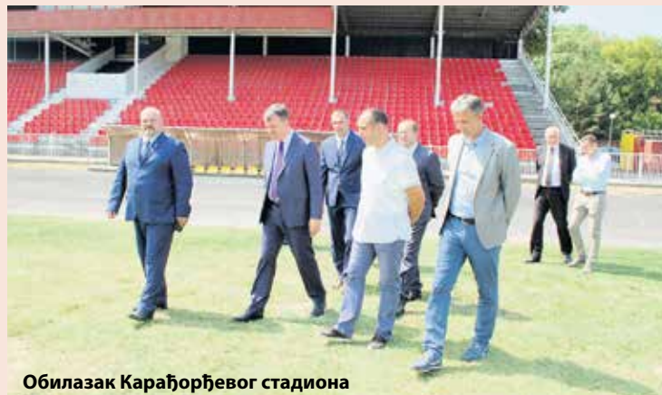
Обилазак Карађорђевог стадиона