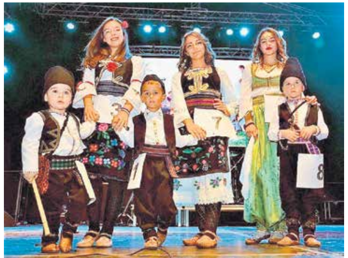
Најлепше чобанице и чобани