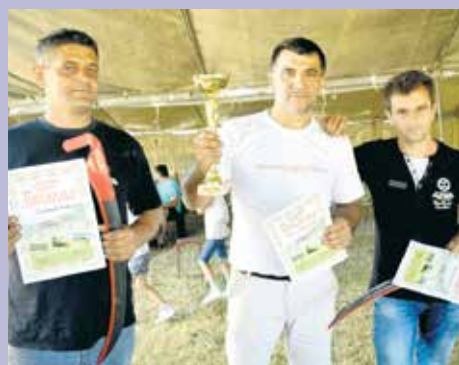
Победници „Гвоздачких дана“