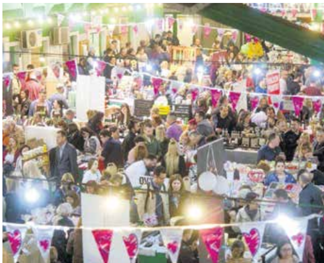
Атмосфера на једном од Београдских ноћних маркета

Како најављују организатори, и овога пута биће велики број дизајнера, занатлија, произвођача хране и пића, а понуду ће употпунити и нови излагачи. Посетиоци ће моћи да уживају и у занимљивом музичком програму, а за најмлађе су припремљене различите радионице. Улаз је слободан.