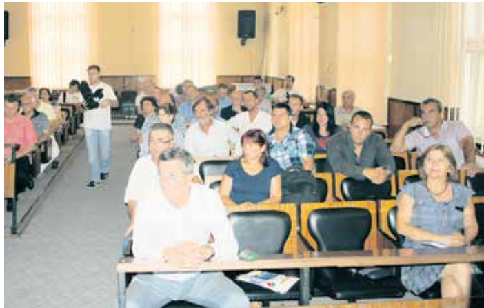
Са скупа у Неготину

– Повезивање са нашом дијаспором представља значајан потенцијал за развој привреде