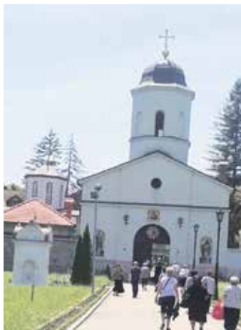
Паланачки пензионери у манастиру Раковица

У наредном периоду за паланачке пензионере биће организовани излети до Суботице и Палићког језера, Бање Ковиљаче и родног места Вука Караџића – Тршића. Планира се путовање у Тополу, када се буде одржавала традиционална берба грожђа и чувени вашар.