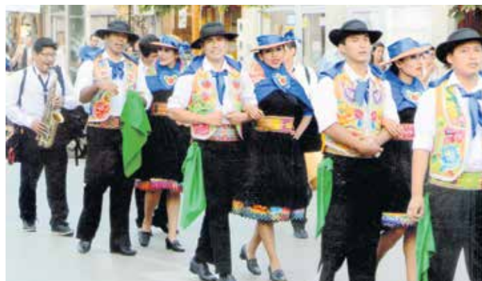
Фолклорни ансамбл из Чилеа

Поред наступа фолклорних група, и на овом културном лету ређале су се представе за децу, радионице певања, бесплатне биоскопске пројекције, одржан је мини сајам књига, затим концерт оркестра трубача Бобана Марковића и бројне друге манифестације. Пироћанци