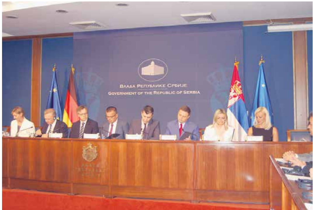
Са потписивања меморандума у Влади Србије

– Берачи воћа, поврћа и сви они који су ангажовани током пољопривредне сезоне врло ретко због бирократских пре-