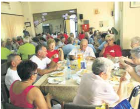
Велика сала угошћује бројне пензионере и са стране

Успоставили су добру сарадњу са бројним колективима у селу. Члановима су обезбедили бројне погодности: снабдевање огревом на 10 до 12 месечних рата, воће и поврће могу да купе на три месечне рате, затим сухомеснате производе и свеже месо у неколико продавница по вољним условима.