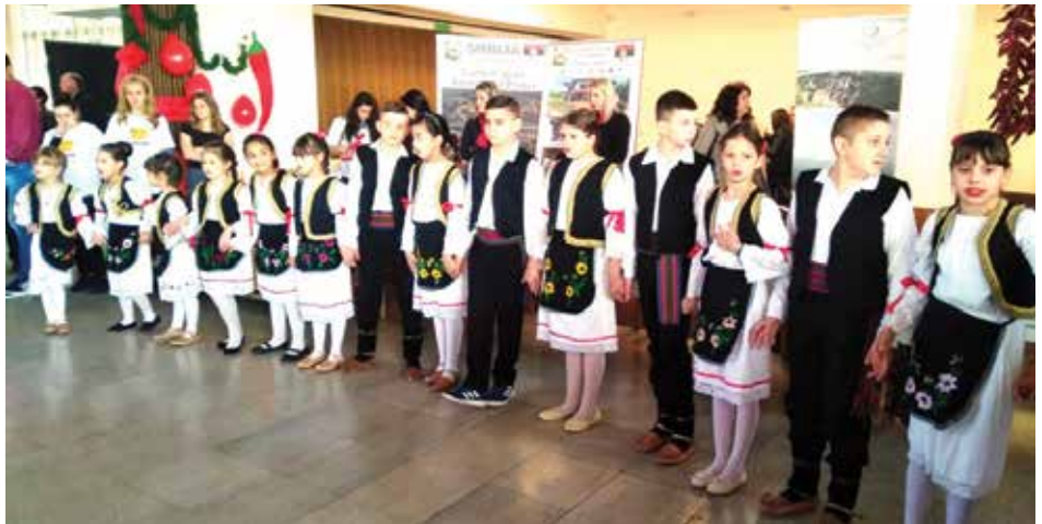
Наступ најмлађе групе КУД „Света Тројица” из Бољара