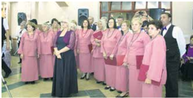
Хор Удружења жена „Јесен живота“ из Шида