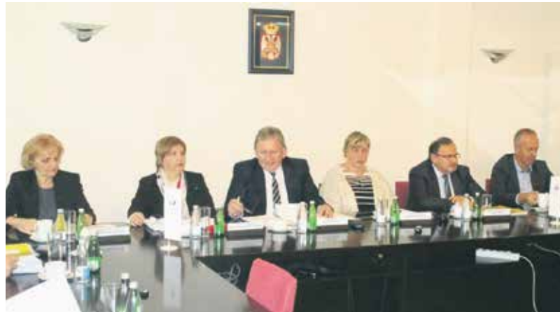
Са седнице Управног одбора РФ ПИО

– Трансфери из буџета су изменама и допунама Финансијског плана Фонда за 2018. годину смањени у односу на првобитно планирани износ за 7,3 милијарде динара и износе