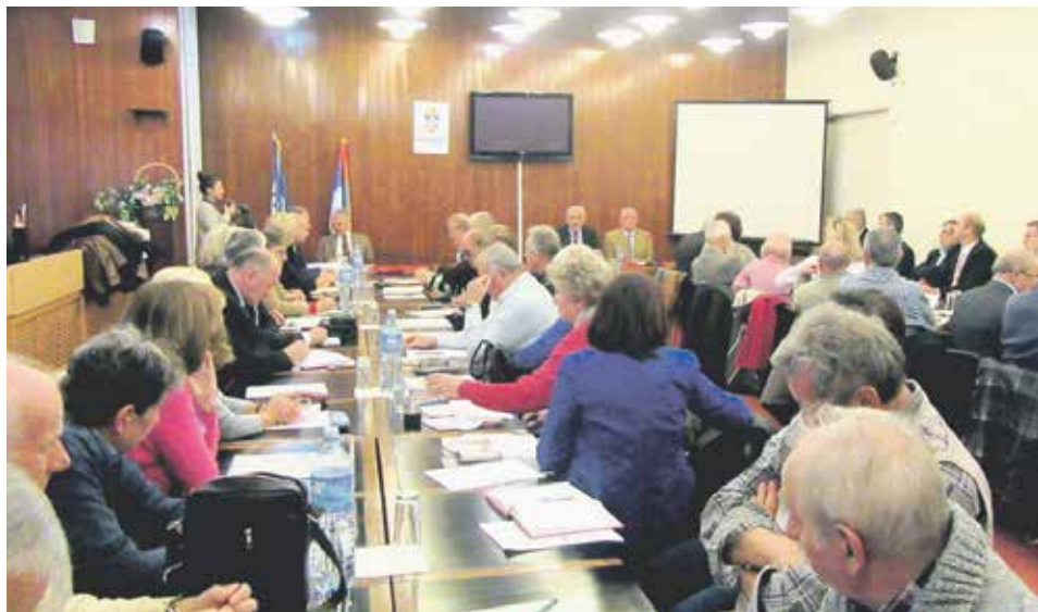
Оснивачка скупштина Покрета трећег доба Београда

П окрет трећег доба Београда основан је крајем новембра на иницијативу чланова удружења пензионера са подручја Београда, а уз подршку и у сарадњи са Покретом трећег доба Србије и Градском организацијом пензионера (ГУП) Београда.