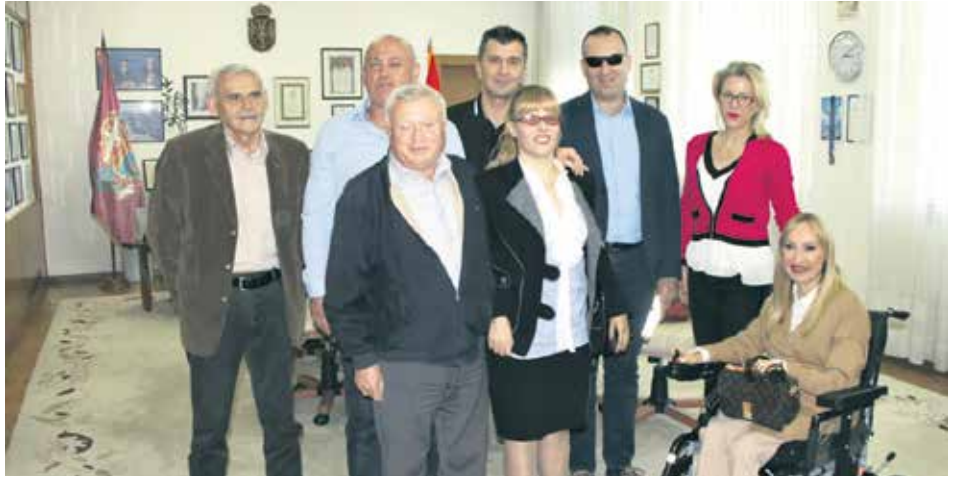
Представници Савеза слепих Србије са министром Зораном Ђорђевићем и в.д. помоћника министра Биљаном Барошевић

С обзиром на то да је у току процес дигитализације, договорено је и да Министарство подржи пројекат Савеза слепих Србије „Дигитализација аудио књига“, што подразумева пребацивање књига са магнетофонских трака и аудио касета у дигиталне формате. У сврху дигитализације аудио књига за слепе и слабовиде особе биће издвојено 1.200.000 динара.