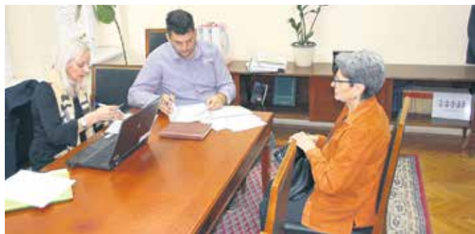
Бачка Паланка била добар домаћин