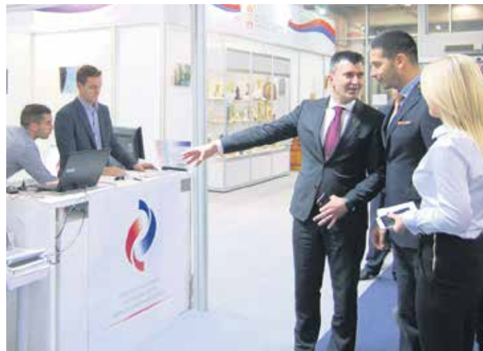
Министри Зоран Ђорђевић и Вања Удовичић посетили инфо пулт Фонда ПИО

код за електронску проверу својих података на сајту Фонда, као и савет од дежурних правника. За недељу дана приближно 500 странака добило је правну помоћ у вези са условима за остваривање права на превремену и старосну пензију, као и обрачуном пензије. Такође је за око 200 особа пружена информација о пензионерским картицама и посетиоцима Сајма подељено око 300 обавештења о овим картицама.