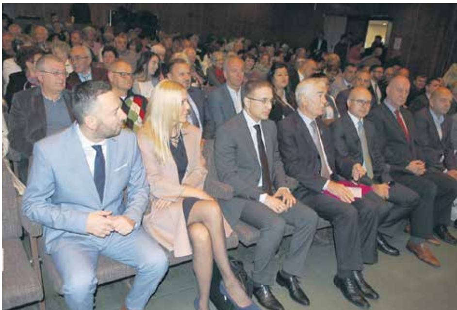
Високе званице на свечаности у Новом Саду

– Министарство унутрашњих послова укључило је прошле године пензионисане полицајце и ватрогасце, људе огромног