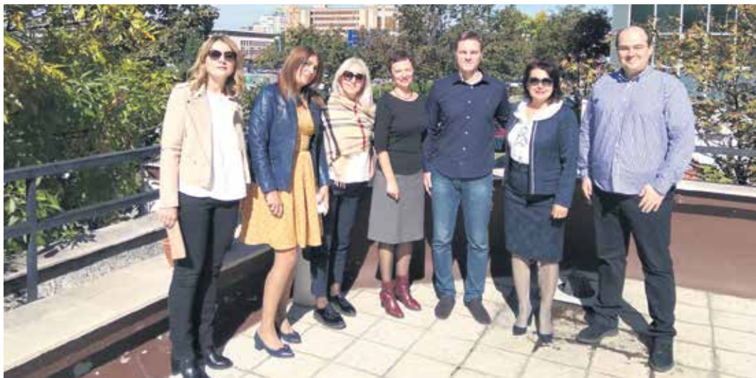
Српски и хрватски саветодавци у Београду

– Ове године најчешћа питања односила су се на стање поступка у Хрватској. Тачније, у којој су фази захтеви који су прослеђени у Хрватску, да ли се може убрзати њихово реша-