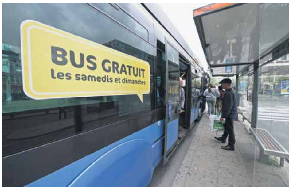
Бесплатно до миле воље: Данкерк на северу Француске

У новој рачуници важан момент је да су у међувремену транспортне таксе повећане. Одатле се надокнађује мањак створен изо-