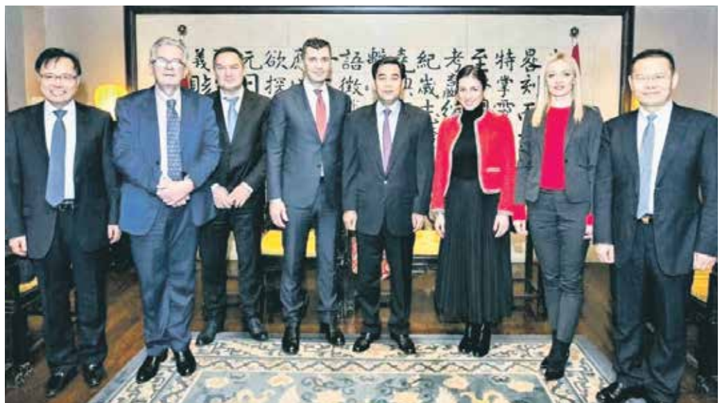
Кинеска и српска делегација на потписивању споразума

Недавна посета нашег председника Кине додатно је унапредила већ постојеће добре односе наше две земље, а потписивање Споразума резултат је обостране жеље за интензивирањем сарадње у области социјалне сигурности. Верујемо да ћемо њиме омогућити остваривање свих права наших грађана који живе и раде у Кини, а исто тако и њиховим грађанима који су у Србији – истакао је министар. Г. О.