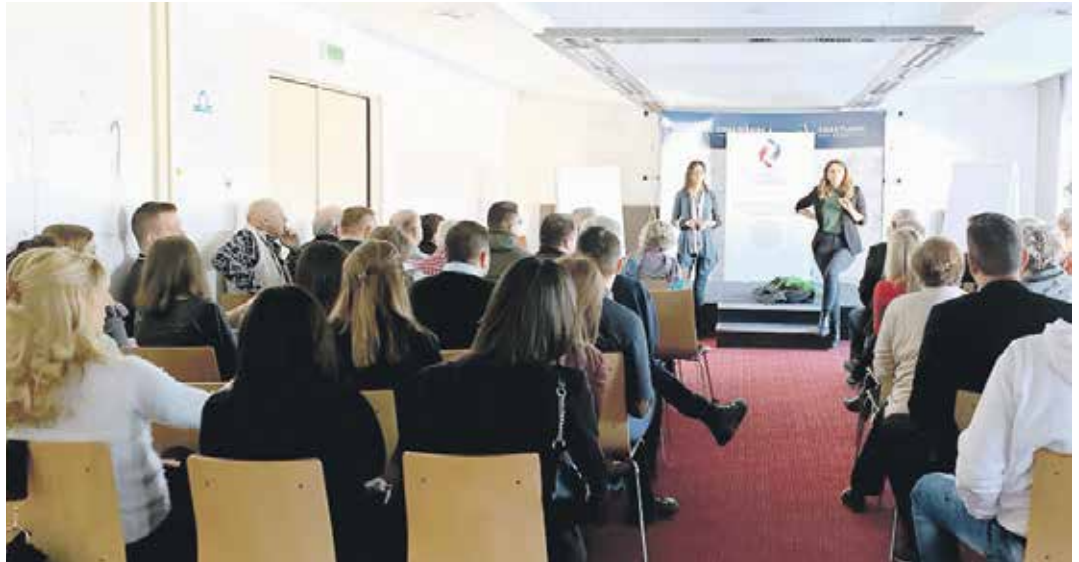
Једно од предавања у оквиру радионице о међугенерациској сарадњи

– Фонд ПИО, као носилац пензијског система Србије, који се заснива на принципима међугенерациске сарадње и солидарности, препознао је своје ангажовање у правцу унапређења поло-