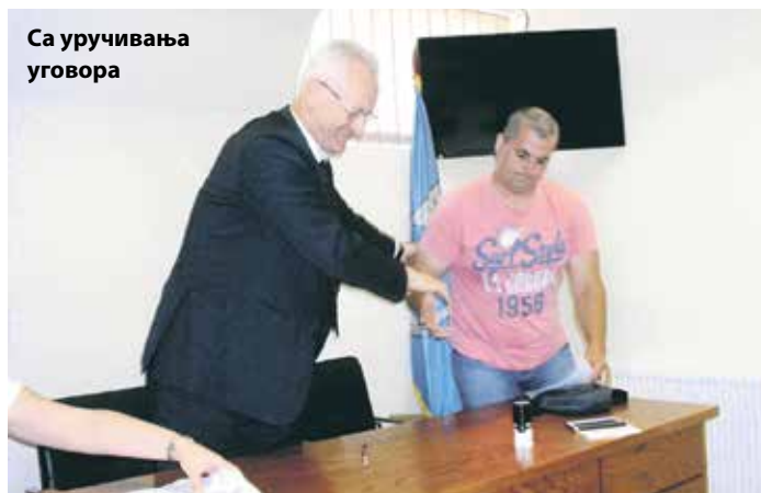
Са уручивања уговора

– Добили смо бесповратна средства од око 7,5 милиона динара. Искористићемо их углавном за набавку опреме за производњу воћних ракија. Закупили смо плац у вароши на коме ћемо