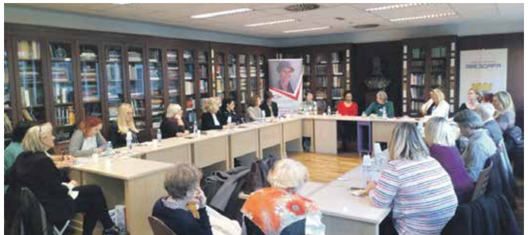
Округли сто посвећен унапређењу квалитета живота оболелих и њихових неговатеља