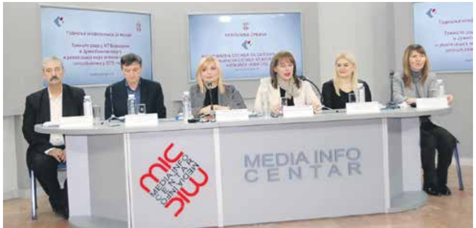
Са конференције за медије НСЗ у Новом Саду

– Овако удруженим средствима током прошле године је више од 2.400 незапо-