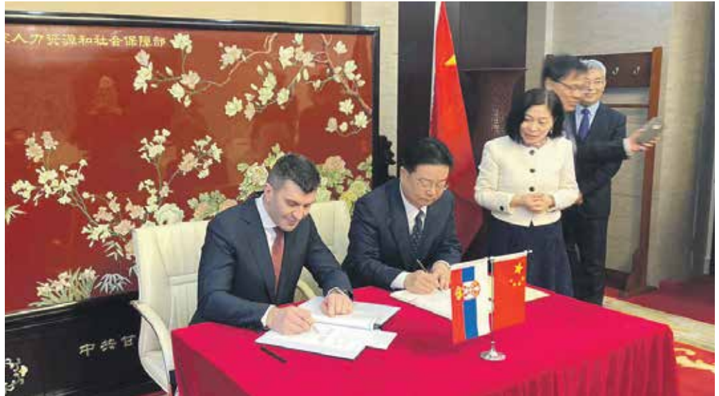
Потписан Споразум о социјалној сигурности у Пекингу

М инистар за рад, запошљавање, борачка и социјална питања, Зоран Ђорђевић, потписао је у Пекингу Споразум о социјалној сигурности између Владе Републике Србије и Владе Народне Републике Кине, којим ће се уредити остваривање права из пензијског и инвалидског осигурања, као и права за случај незапослености за држављане обе земље.