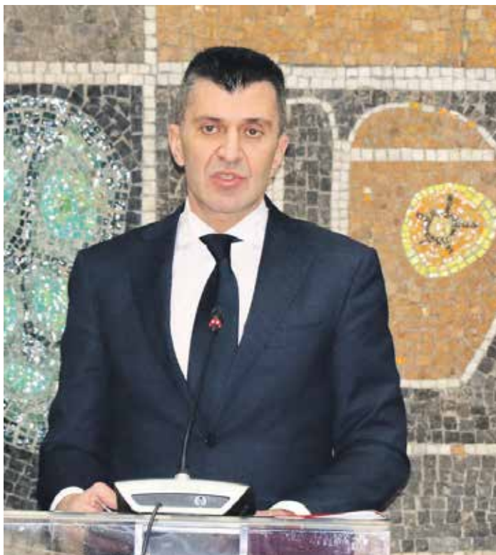
Министар Зоран Ћорђевић

– Задржавање младих у својој земљи, привлачење странаца, борба за сваки нови живот и већи наталитет, бољи стандард за наше најстарије грађане, унапређење положаја особа са инвалидитетом и припадника ранијих категорија становништва, очување традиције и борачких права, израда социјалних карата, смањење незапослености, социјална заштита, даљи рад