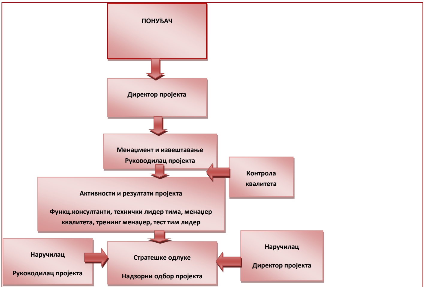
Слика 1 – Организација пројекта

Успостављање ефикасне организације пројекта је предуслова за његов успех. Сваки пројекта захтева дефинисање правца и циљева, управљање, контролу и комуникацију. Захтевана методологија реализације пројекта предвиђа да горе наведени елементи буду флексибилни, управљиви и међусобно повезани и на тај начин омогућавајући да се прилагоди било ком пројектном окружењу. Добра организација пројекта, осим веза између учесника у њему, дефинише прецизно улоге и одговорности на пројекту. Главни учесници у пројекту и њихове улоге су описани у даљем тексту.