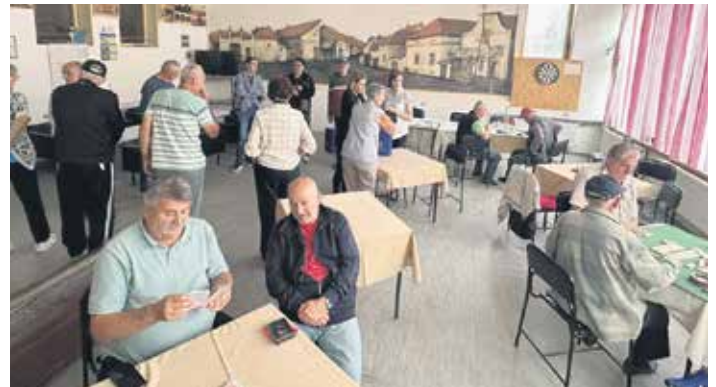
Трстенички пензионери у свом клубу

Према његовим речима, повољности које чланови ове организације могу користити, поред Фонда солидарности, су набавка животних намирница,