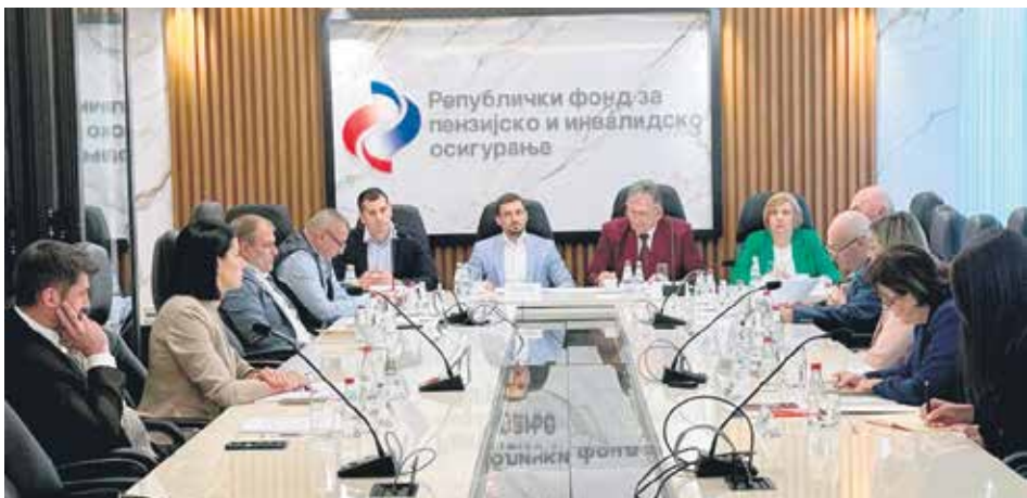
Са седнице Управног одбора РФ ПИО одржане 29. априла

– Значајно је рећи да смо и у 2023. години наставили тренд са суфицитима, који нас прати од 2021, а рекордни суфицит је био 2022. године. Током прошле године смо имали укупно повећање пензија од 18,3 одсто и исплату помоћи од 20.000 динара. Упркос свему томе, имали смо бољу наплату доприноса током претходне године и с