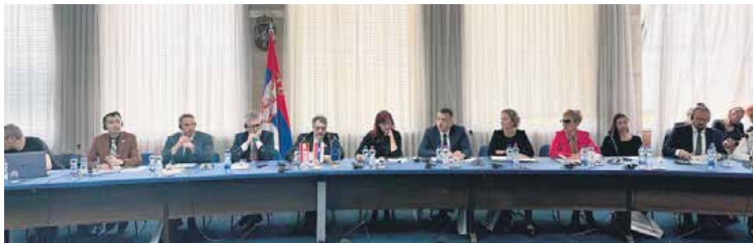
Пројекат је окупио бројне партнере: представнике јавног и цивилног сектора, независних регулаторних институција, професионалце који раде са старијима

– У Србији је кампања „Замисли се“ видело више од 1.300.000 људи, а конзервативна је процена да ће је до краја видети преко 2.000.000. У кампањи су учествовали и волонтери Црвеног крста и Повереница за заштиту равноправно-