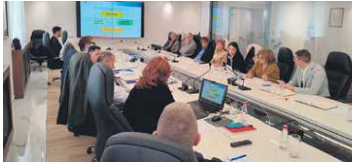
Састанак у Београду одржан у оквиру размене реформских искустава и примера добрих пракси економија Западног Балкана

Пошто је Фонд ПИО, у сарадњи са другим државним институцијама, успешно спровео ову реформу и пошто систем електронског пријема података из пореских пријава са формирањем образаца стажа функционише већ неколико година, на састанку су представљена искуства Фонда на том путу и извршена презентација функционисања овог система са циљем да послужи као пример и помоћ институцијама Црне Горе у предстојећим реформама.