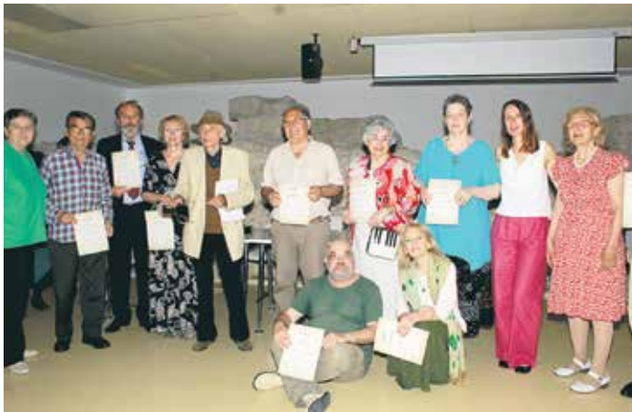
Неки од ранијих лауреата „Драганове награде“