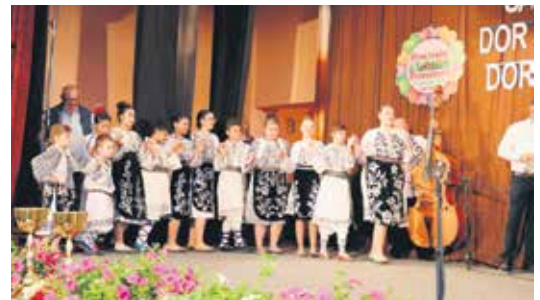
Радост пролећа уз чување традиције

ријама. Програм је имао четири категорије а велики трофеј Дечјег пролећног фестивала „Чежња за пролеће, чежња за Еминескуа“, према оцени жирија, освојила је школа која је учествовала у свим категоријама – Основна школа „2. октобар“ из Николинаца. Запажен наступ имале су и бројне вокалне групе и хорови, а посебно Дечји хор Румуна у Србији „Кармина Феликс“.