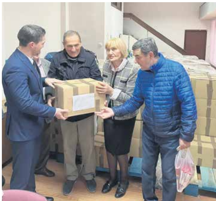
Са прошлогодешње поделе пакета солидарне помоћи у Новом Саду

Да подсетимо, основни критеријум за доделу солидарне помоћи је висина пензије до 24.987,67 динара, а приликом утврђивања ранг-листе предност имају самохрани корисници или корисници у вишечланом домаћинству коме је једини извор прихода пензија (која не прелази најнижи износ пен-