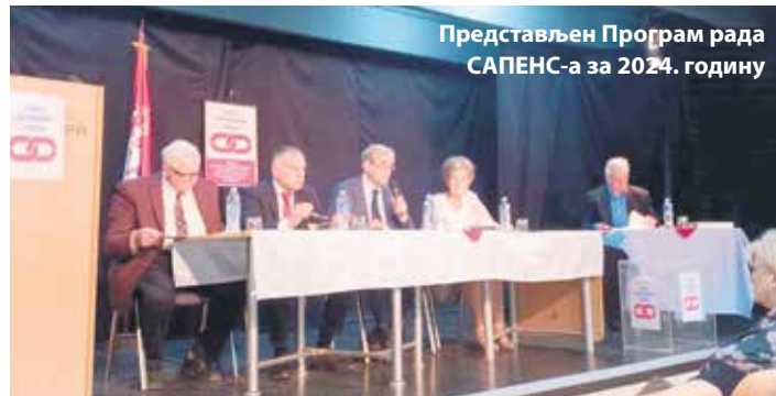
Представљен Програм рада САПЕНС-а за 2024. годину

Предвиђено је и даље остваривање и унапређење сарадње