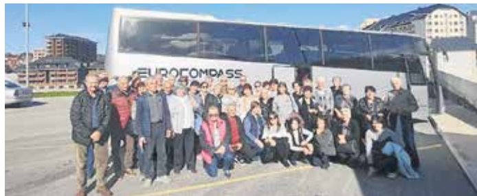
Увек расположени за излете и путовања