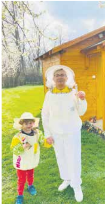
Помаже цела породица, и најмађи се укључују

– У време активне паше пчеле јако комуницирају са природом и обилато скупљају нектар, полен из окружења. Тада пчелињак мирише на све стране, јер пчеле махањем крила врше хипервентилацију како би одузеле вишак воде из својих произ-