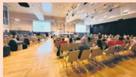
Представници Фонда учествовали на конгресу лекара вештака у Лашком

На конгресу су, такође, представљени системи пензијског и инвалидског осигу-