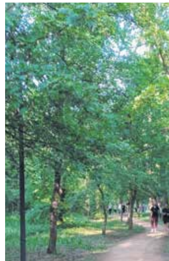
Шуме Забрана важне за животну средину у обреновачкој општини

Од садржаја у централном делу излетишта налази се Авантура парк са висинским полигонима, тјубинг стазама, трамболином, тереном за мини голф... Постоји трим стаза у дужини од 1,5 км, од шљунка и ломљене цигле, и мост који спаја стазу са колубарском долмом. Поред понтона за купаче, уређена је песковита плажа у дужини од 500 метара, са тушевима. Ради веће безбедности посетилаца и излетника дуж пута је изгра-