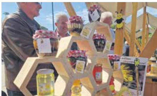
Највише је било производа од меда и прополиса

– Ове суботе имамо прилику да се дивимо разноликости боја, мириса и укуса које нам природа пружа. Лесковац разним манифестацијама посвећено чува традицију овог краја, а сада свој дан имају и пчелари, медари и цвећари зато што њихов рад заслужује подршку и афирмацију – истакла је Димитријевић.