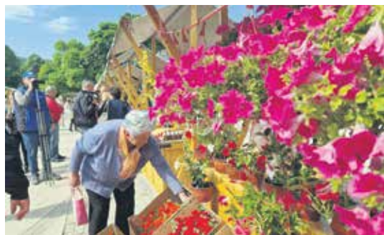
Изложба цвећа за уживање и добро расположење

На лепо уређеним штандовима, поред производа од меда, природних козметичких производа и цвећа, била је изложена и савремена опрема у пчеларењу, у врцању меда, као и бројни производи за хортикултуру и заштиту цвећа.