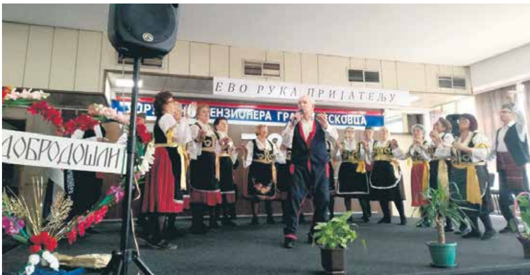
Наступ фолклораша сениора из Врања

Велики број учесника и изузетно богат програм обележио је десету по реду манифестацију фолклора ветерана „Ево рука, пријатељу“, одржану 25. марта у великој сали лесковачког Дома пензионера. Ова јединствена регионална смотре фолклора одржана је у част обележавања 15 година од оснивања Клуба пријатеља старих, који ради у оквиру Удружења пензионера Лесковац.