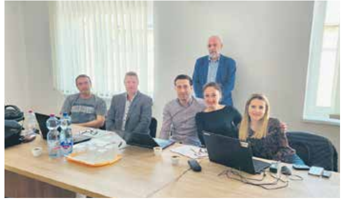
Филијала РФ ПИО Пожаревац је први пут била домаћин саветовања

Првог дана саветовања у Пожаревцу интересовање