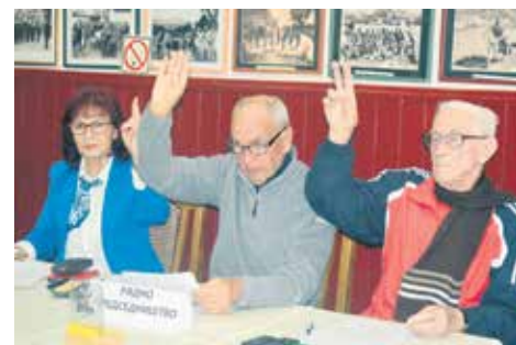
Са изборне Скупштине бајинобаштанског Удружења пензионера

На истој седници усвојени су и извештаји о раду и финансијском пословању Удружења за 2023. годину и извештај Надзорног одбора за исти период. Истакнута је примерна активност Удружења на пословима као што су подела пакета најсиромашнијим члановима, укупно 280, а добили су их сви који су се пријавили са потребним условима; затим посредовање код пријављивања за бесплатну рехабилитацију у бањама; реконструкција Клуба пензионера са терасом и замена дотрајалог крова; спортске активности; посете другим удружењима, летовања, излети, обележавање значајних