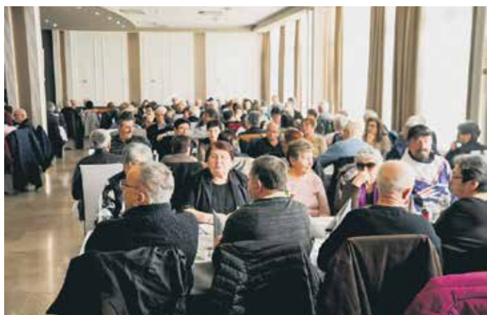
Трибини у Кладову присуствовало је више од 350 пензионера

пензија, током године ће се организовати трибине намењене пензионерима. Ове активности ће заједно реализовати Савез пензионера Србије и Републички фонд ПИО, уз подршку локалних самоуправа и партнерских фирми. С обзиром на то да је у питању нови вид друштвеног стандарда, циљ је да се кроз организовање трибина корисници упознају са овим начином подршке и да се директно од њих добију смернице на који начин би овај вид друштвеног стандарда могао да допринесе да се унапреди квалитет живота и подстакне друштвена активност корисника у трећем животном добу.