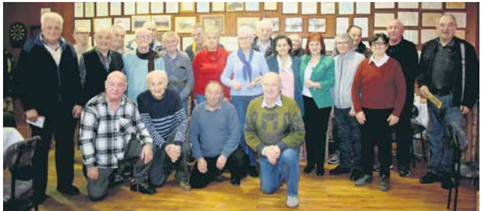
Чланови Скупштине Удружења пензионера Бајина Башта

Било је и више спортских активности: општинско и регионално такмичење и учешће на Олимпијади у Врњачкој Бањи, наступи у Дринском купу где је освојено прво место, као и на окружном нивоу. Орга-