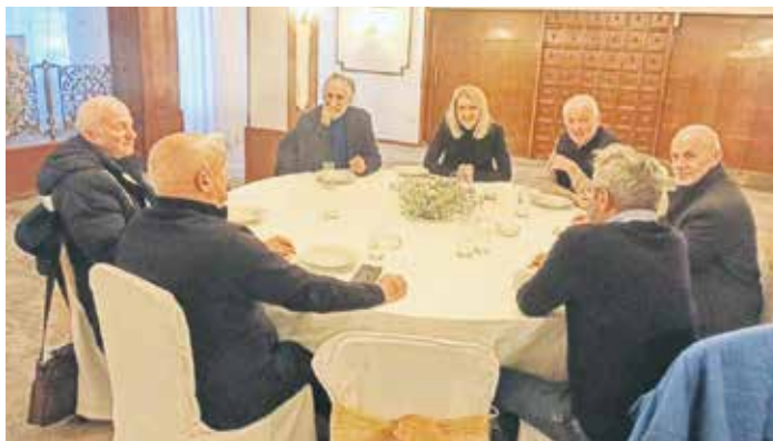
Са састанка Радне групе за питања бриге о старијима

Током протеклог периода Радна група је спровела читав низ активности. Концептуализован је програм обуке под називом „Менаџмент волонтера – програм обуке за успостављање и вођење волонтерских сервиса у локалној заједници“, који је акредитован решењем Министарства за рад, запошљавање, борачка и социјална питања. Ослободене на актуелну националну Стратегију о здравом и