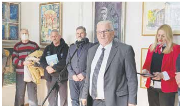
Са отварања ретроспективне изложбе Покрета трећег доба Ниша