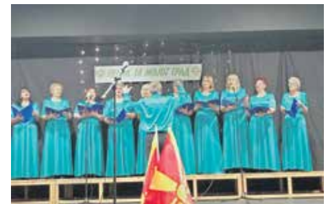
Наступ Лесковчанки у Винаци

Лесковачко Удружење пензионера је, крајем прошле године, поводом Дана града Лесковца, потписало Повељу о братимљењу са Удружењем пензионера општине Винаца. Своје потписе на повељи ставили су нови-