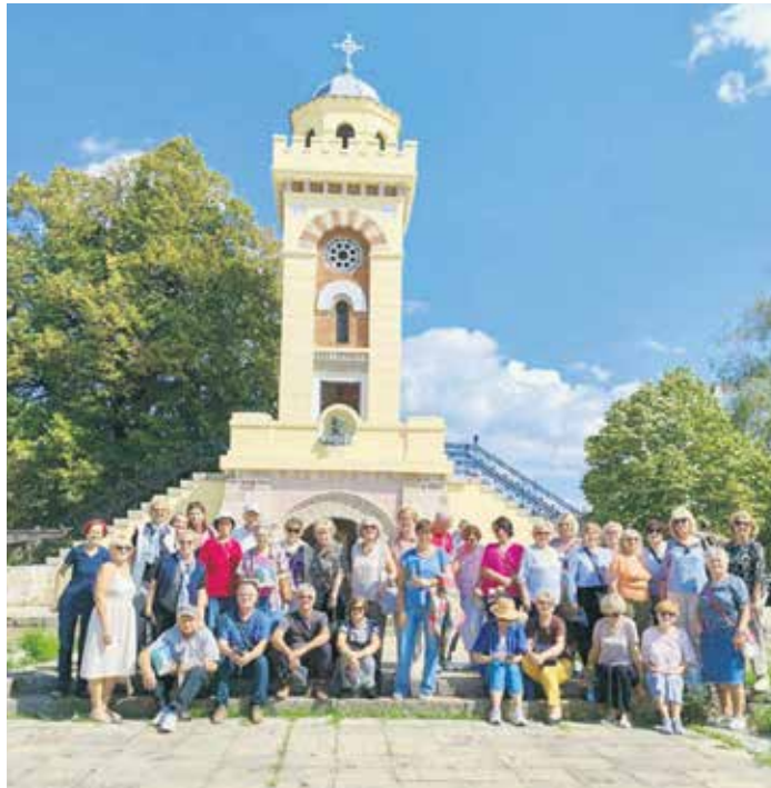
Са једног од путовања „Хиландараца“