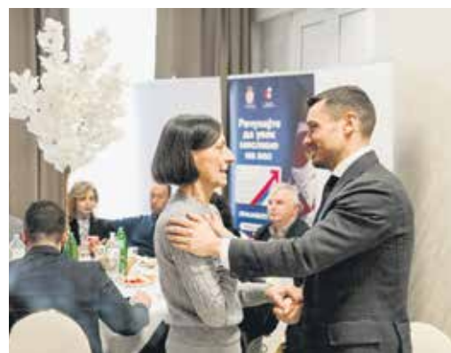
Директор Фонда у разговору са пензионерима Лучана