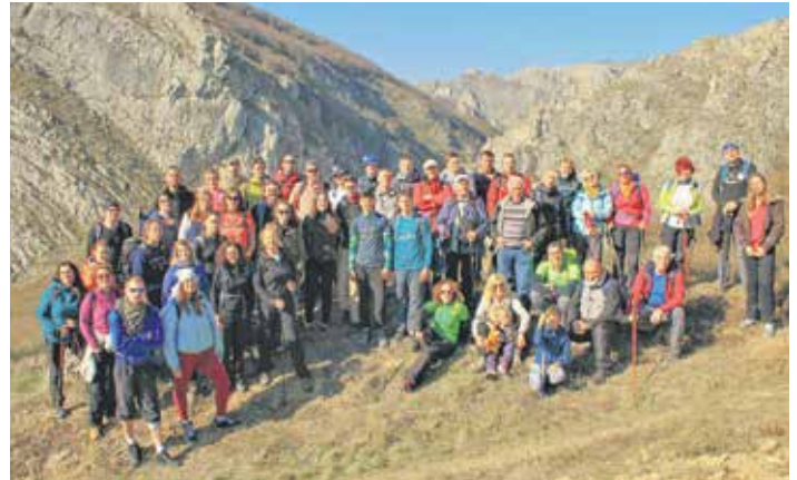
Туристи у Нишевачкој клисури

У Нишевцу се налази и Визиторски центар, у којем је изложено више од 150 предмета из периода од праисторије до средњег века, пронађених на територији општине Сврљиг, као и реплике ратника из различитих историјских епоха. Велики допринос развоју туризма даје село Копажкосара, познато по пећини Самар и музеју, као и по спелеологу Милутину Вељковићу који је у овој пећини поставио светски рекорд у боравку под земљом. Важни локалитети су и Попшич-