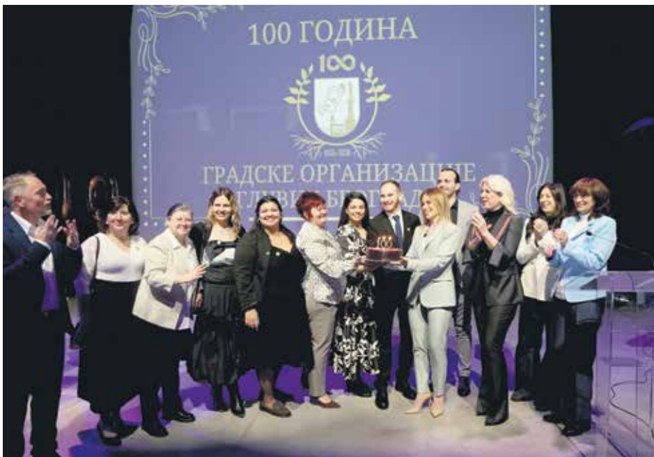
Рођенданска торта поклон министарке Милице Ђурђевић Стаменковски

– Ја сам поносан што сам глув. Ја сам поносан на свој језик – српски знаковни језик, на своју културу и своју заједницу. Током једног века прошли смо кроз тешка времена, многе баријере али и велике успехе. Борили смо се за право на образовање, на доступност информација, на запошљавање и најважније – право на равноправност. Данас смо видљивији, снажнији, организованији него икада пре, али наш посао није завршен. Пред нама су нови изазови, нове генерације и нове прилике. Наша визија остаје јасна, друштво без баријера – нагласио је.