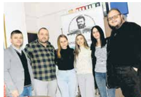
Чланови клуба Фото библиотека

Прозаистима, песницима, ауторима почетницима, читаоцима различите доби, ученицима, студентима и свима онима које интересују књижевност и културно стваралаштво широм су отворене двери Литерарног клуба. Новоосновани клуб „Родна реч“ организовале књижевне вечери, јавна читања писаних дела, промоције књига и аутора, радионице креативног писања, сусрете са писцима, тематске дискусије, учешће у културним манифестацијама и реализацији пројеката од важности за станоштво босилеградског крајишта.