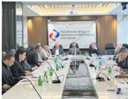
Са седнице Управног одбора Републичког фонда ПИО

Како је објаснио у наставку образлагања, то ће се постићи кроз унапређење ажурности у спровођењу пензијског и инвалидског осигурања, затим кроз унапређење техничко-технолошке подршке основној делатности, као и успостављањем оптималне кадровске структуре и квалитетном радном средином и опремљеношћу радних места.