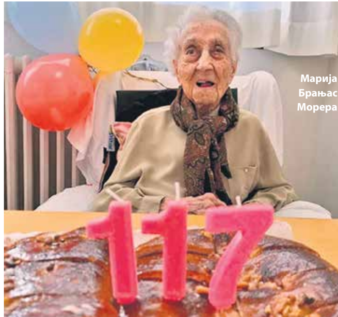
Марија Брањас Морера

Научници су недавно добили прилику да спроведу свеобухватан низ тестова и испитивања на тада најстаријој суперстогодишњакињи на свету. Наиме, Марија Брањас Морера, до своје смрти у доби од 117 година и 168 дана, дакле до августа 2024. године, била је тада најстарија верификована жива особа