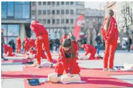
Јубилеј обележен и јавним часом на Тргу Републике

ВЕЋА ИЗДВАЈАЊА РЕСОРНОГ МИНИСТАРСТВА ЗА УСЛУГЕ СОЦИЈАЛНЕ ЗАШТИТЕ