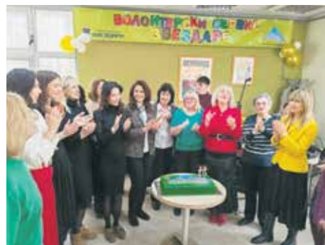
Традиционална прослава уз рођенданску торту

Срце Сервиса чине волонтери који, мотивисани добром вољом и хуманошћу, свакодневно у кућним условима помажу великом броју старих, болесних и немоћних.