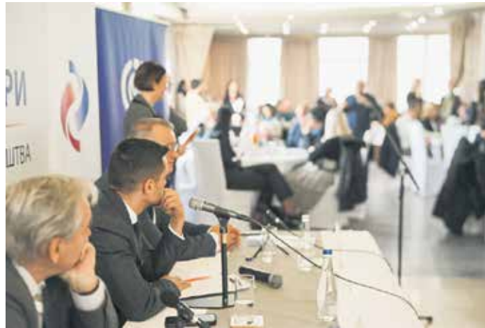
Корисници пензија су на трибинама имали прилику за директан разговор и размену информација

Два дана касније, 26. фебруара, више од 350 пензионера присуствовало је трибини у Кладову, током које су имали прилику за директан разговор, размену информација и разматрање конкретних предлога за унапређење квалитета живота у трећем животном добу са учесницима трибине, а поред директора Фонда ПИО и пред-