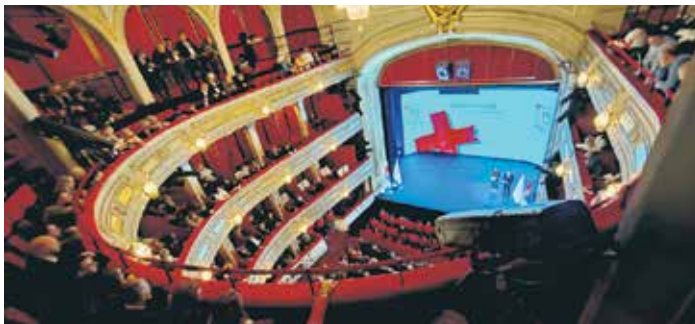
Свечаној академији присуствовали су високи представници Републике Србије, Међународног покрета Црвеног крста и Црвеног полумесеца

Наредне године и деценије, без обзира на тешкоће и узастопне ратове, велики број рањеника, избеглица и све изазове кроз које је пролазио народ на овим просторима,