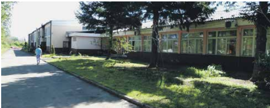
ДП Универзал: проблеми трају годинама

Министарство за рад, запошљавање, борачка и социјална питања колективу прослеђује седамдесет пет одсто зараде, али како је предузеће у великој беспарици, нису у стању да исплаћују ни та средства и да правдају њихово трошење.