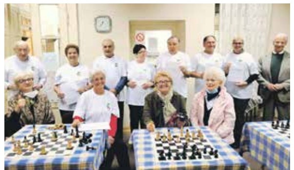
Сомборци се надметали и у шаху