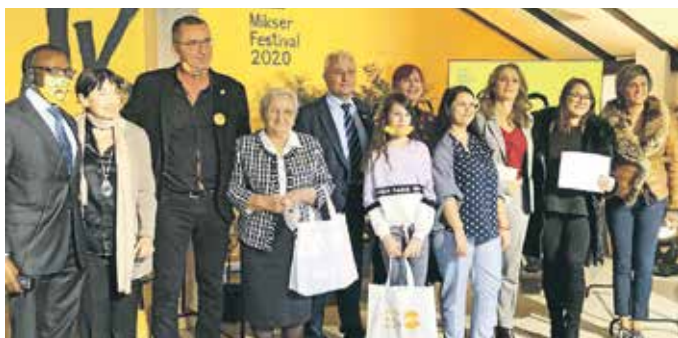
Са доделе награда: организатори и награђени аутори

Црвени крст трстеник обележио дан старих