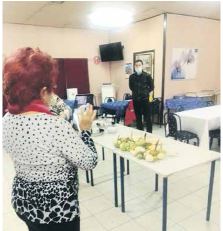
Обука за коришћење таблета

– Знање које старији стекну током ових обука користиће им да касније могу лакше да буду