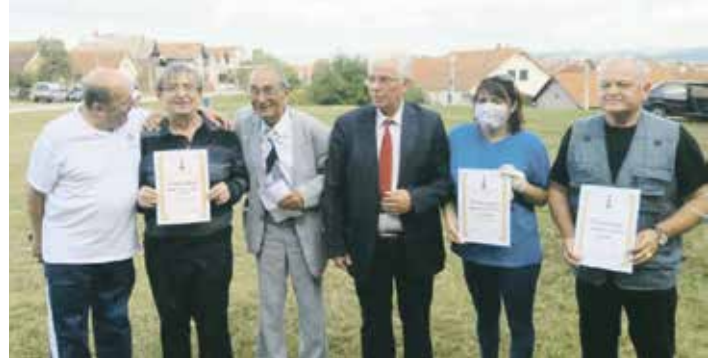
Добитници признања за постигнуте резултате

Мини олимпијаду је у име Покрета трећег доба Србије (ПТДС) и Савеза пензионера