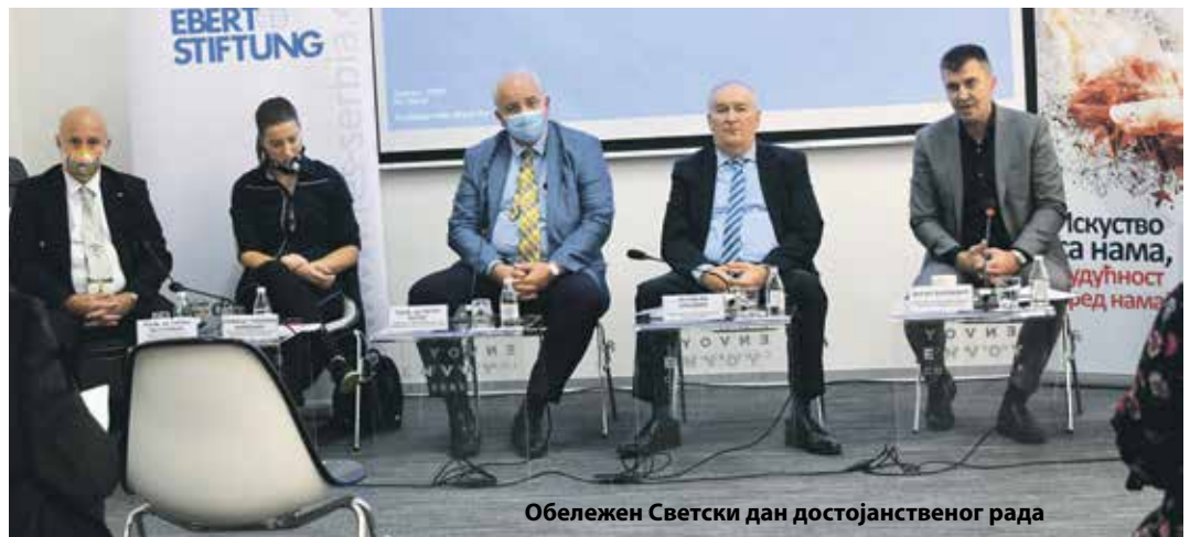
Обележен Светски дан достојанственог рада

– За достојанствен рад грађани треба да се боре радом, а циљ државе је да се достигне минимална потрошачка корпа са минималном ценом рада. Такође, радни амбијент треба уредити по мери наших грађана, како би и радници и послодавци били задовољни – изјавио је Ђорђевић и додао